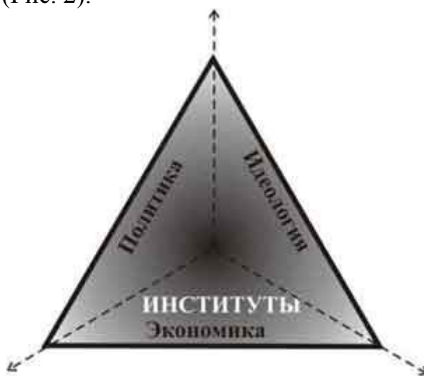
Рис. 1. Схематическое представление институциональной матрицы

На основе заданных постулатов формируется основное понятие, посредством которого, по нашему мнению, можно охарактеризовать тип любого общества, а именно – «институциональная матрица» 5 . Матрица в переводе с латинского означает «матку», основу, первичную исходную модель, форму, порождающую дальнейшие последующие воспроизведения чего-либо. Соответственно, институциональная матрица общества означает первичную модель базовых институтов, т.е. связанных между собой экономических, политических и идеологических институтов, находящихся во взаимно однозначном соответствии (Рис. 2).